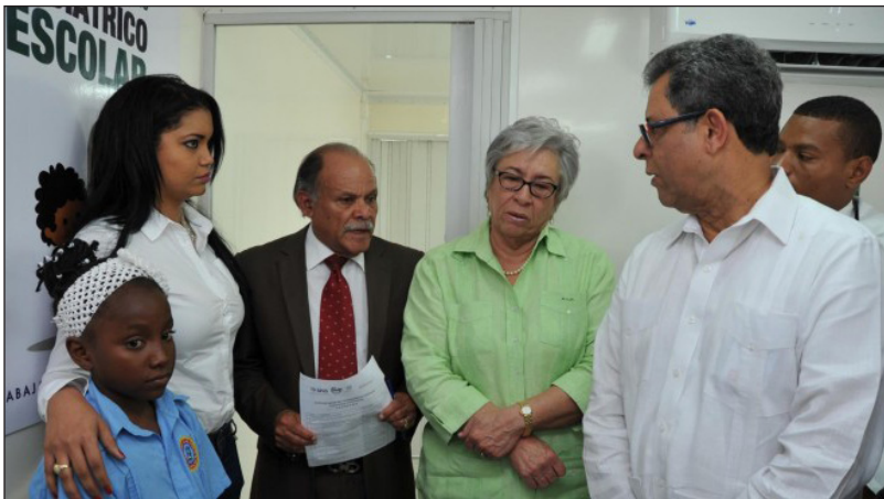
Fundación y Ministerio de Salud Pública inauguran programa pediátrico.