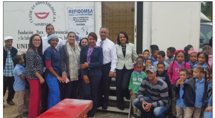
Fundación Refidomsa y Fundación Sonrisas dan inicio a operativos odontológicos.