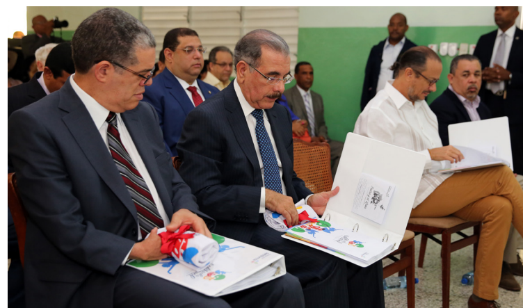
El presidente Danilo Medina y Ministros de Cultura y Educación, evalúan el programa Aula Cultural en su acto inaugural.