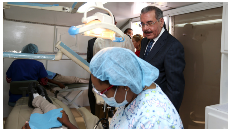
El presidente Danilo Medina supervisa plan odontológico en Nizao, Peravia.

A través del programa de salud dental, desde 2014 se han ofrecido 65,287 consultas, con una inversión global de RD$9 millones, 389 mil, 888. Esto significó un ahorro de RD$152 millones, 945 mil, 950 para las familias beneficiadas.