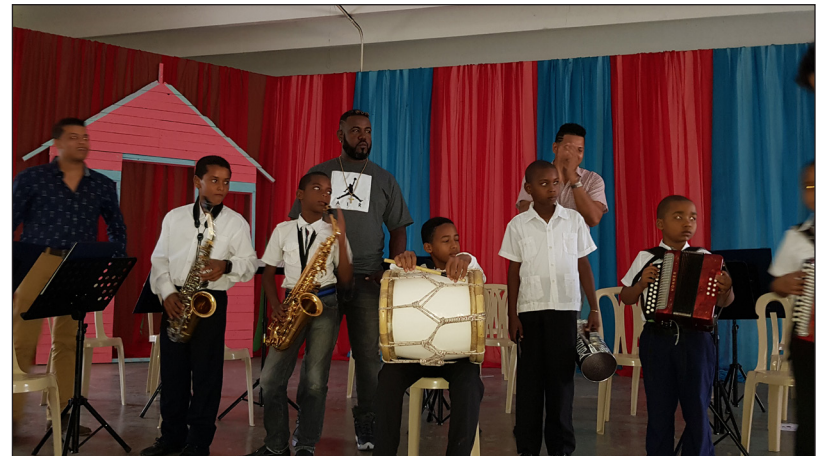
Conjunto infantil de merengue típico de Haina y sus profesores.