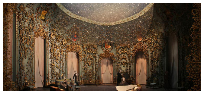
Escenografía de La Traviata (Metropolitan Opera, NY)